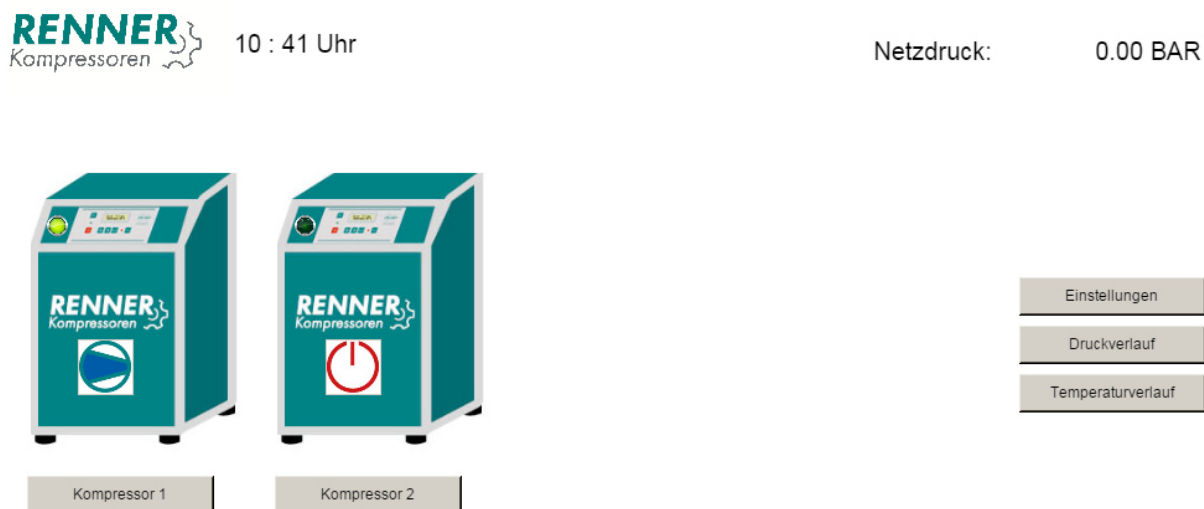
Изображение 2: Главное изображение контроллера RENNERcontrol при Web-визуализации

На главном изображении отображаются подключённые установки, датчик сетевого давления и температура.